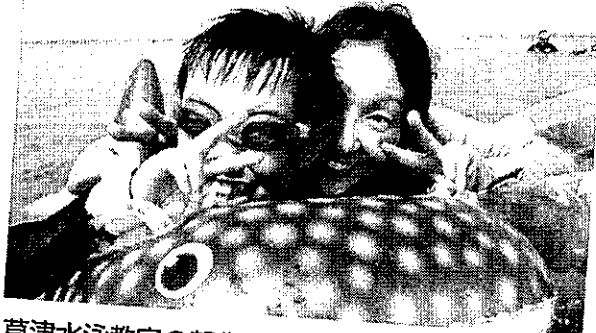
草津水泳教室の報告は23ページをご覧ください。