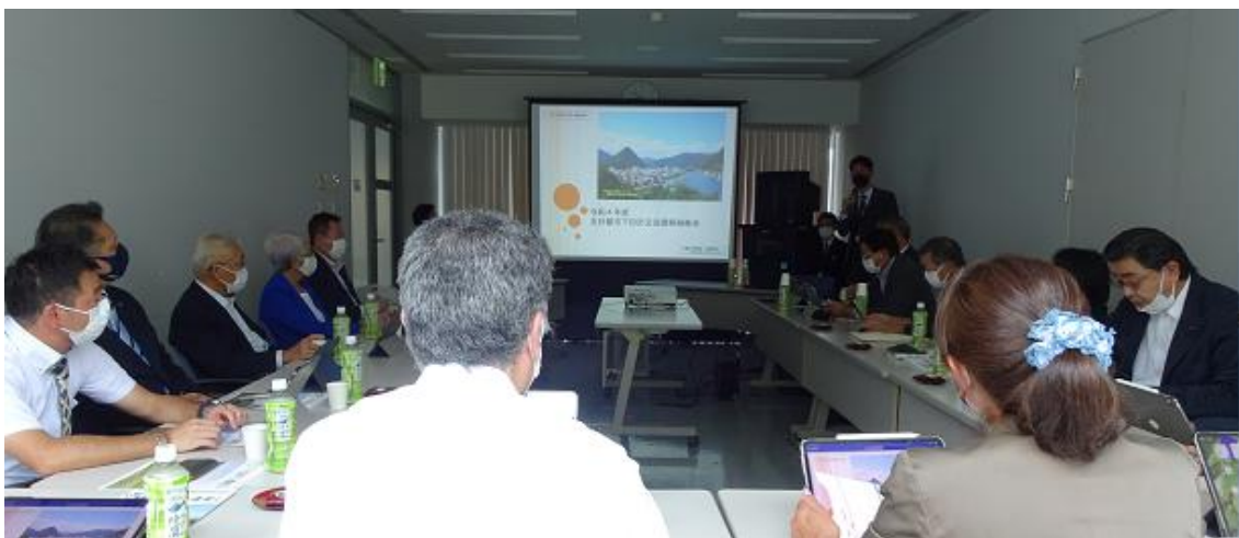
視察研修会の様子（道の駅 開国下田みなと会議室にて）

最後に、過去に新採用研修で行ったという「下田まち遺産出前講座」の一部を体験させていただきました。まず初めに下田市のまちづくりに関する根拠法令など前提の説明があり、そこから、「良好な景観とはなにか」を参加者自らも考え、共有しながら進めていくという流れで構成されていました。市民が市の取り組みや課題を知って自ら考え、関わることで、協働の取り組みとしてまちの遺産（魅力）を守っていくことにも繋がる内容となっていました。