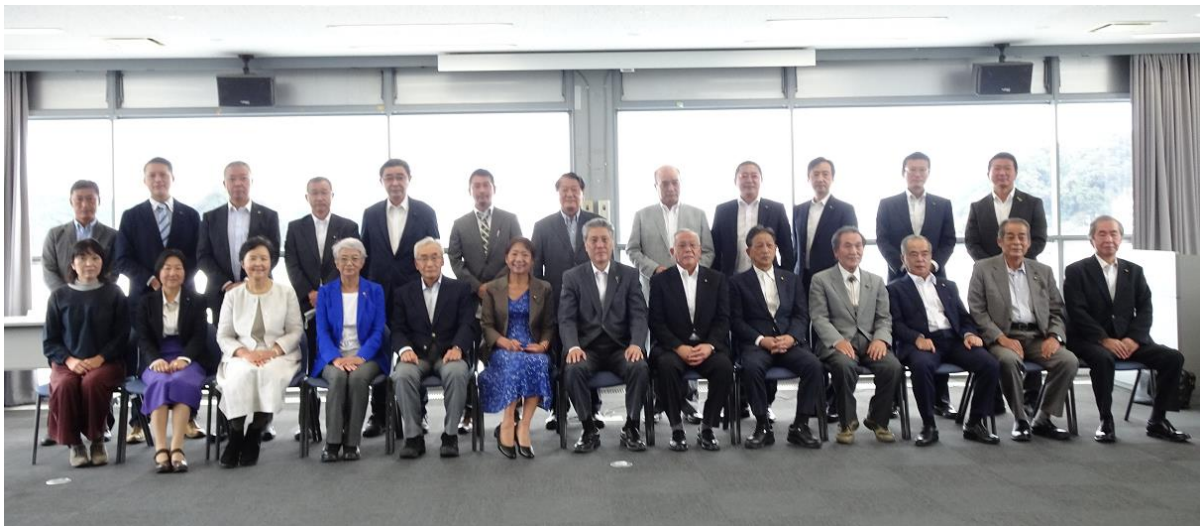
下田市議会議員と葉山町議会議員との集合写真

那須町もそうでしたが制度として「職員出前講座」として位置付けており市民町民とのコミュニケーションツールとしても重要であり、葉山町も工夫をして制度として実施要項等を定め、積極的に行うべき施策だと考えます。