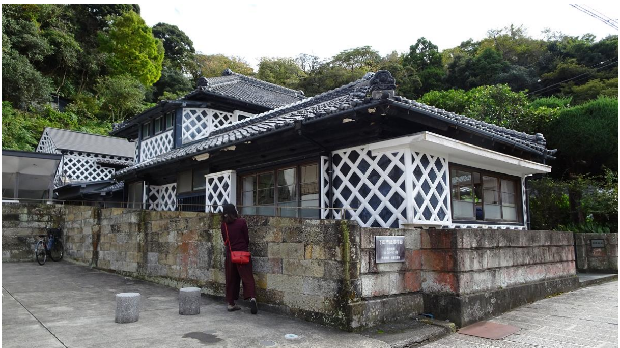
なまこ壁と伊豆石造りの無料休憩所（旧澤村邸）

その後の意見交換会では、東海大地震なら 33 メートルの津波が予測されるなど、下田市の議員の皆さまから貴重なお話を伺うことができました。災害時の応援協定はいま検討中ということですが、どちらも海辺の自治体であることから、同時に大きな被災がないように心から願います。