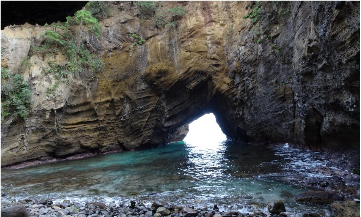
上から眺めるとビーチがハートに見えるという龍宮窟