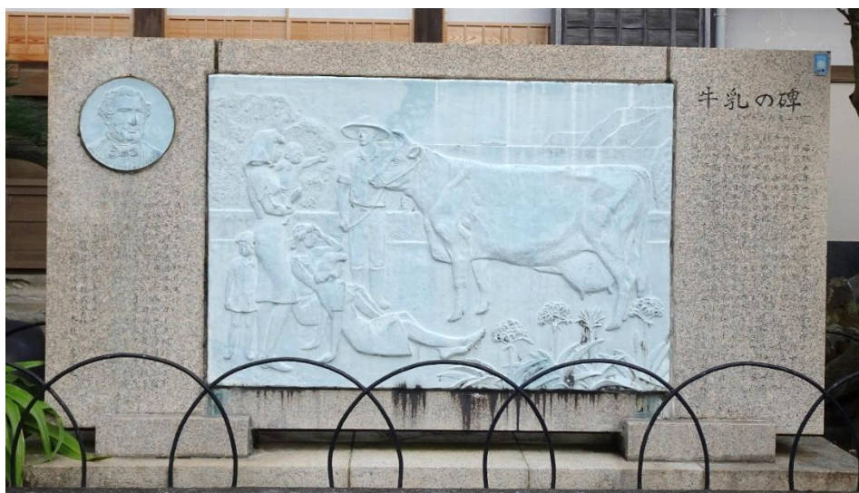
玉泉寺に設置されている牛乳の碑