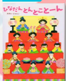
「ひなだんとんとことーん」 おおい じゅんこ/作 ほるぶ出版 2024 Eヒ