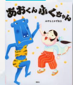
「あおくんふくちゃん」 みやもとかずあき/作 講談社 2024 Eア