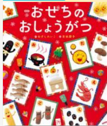
「おせちのおしょうがつ」 ねぎしれいこ/作 吉田朋子/絵 世界文化社 2022 Eオ