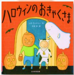
「ハロウィンのおきゃくさま」 レオ・ランドリー/作 木坂 涼/訳 光村教育図書 2019 Eハ