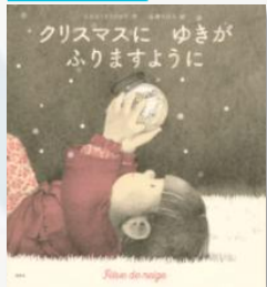
「クリスマスに ゆきがふりますように」 シビル・ドラクロー/作 石津ちひろ/訳 講談社 2023 Eク