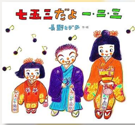
「七五三だよー・ニ・三」 長野 ヒデ子/作・絵 佼成出版社 2016 Eシ