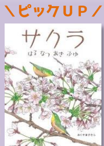
おくやま ひさし/作 ほるぷ出版 Eサ