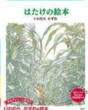
「はたけの絵本」 いむむら かずお/著 創元社 Eハ