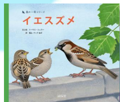
「イエスズメ」 トーマス・ミュラー/文と絵 堀込・ゲッテ 由子/訳 エディション・エフ Eイ