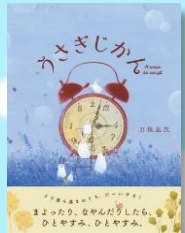
「うさぎじかん」 刀根 里衣/著 NHK出版 Eウ