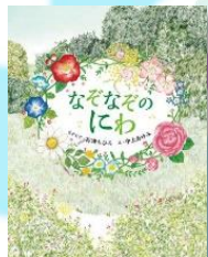
「なぜなににわ」 石津 ちひろ/なぜなに 中上 あゆみ/え 偕成社 Eナ