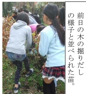
前日の木の掘りだしの様子と並べられた苗。