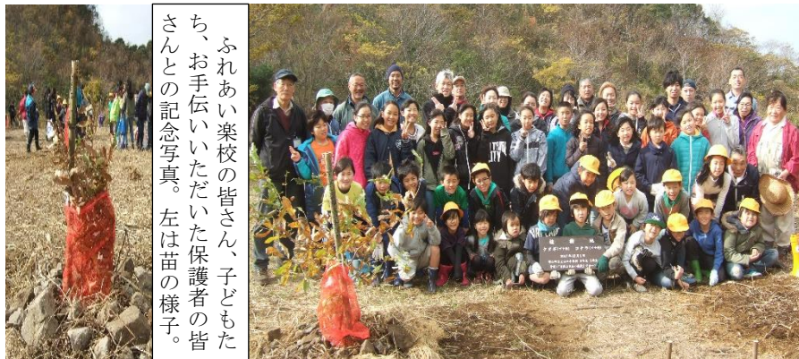
ふれあい楽校の皆さん、子どもたち、お手伝いいただいた保護者の皆さんの記念写真。左は苗の様子。