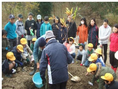
「自然ふれあい楽校」の皆さんが事前準備をし、当日も十一名の方が援助してくださいました。