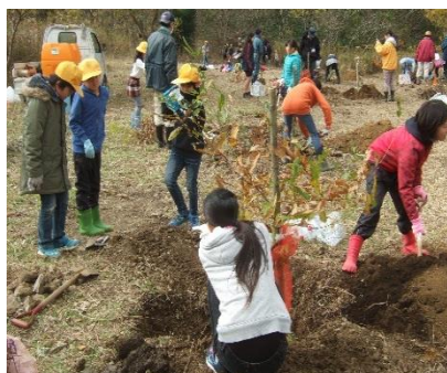
2年生は主に藁・枯草集め、その後6年生と協力して土入れ、水やりを行いました。

木の周囲に敷くわらや草は、最初に2年生が運んだり集めたりしました。その後、6年生と2年生が力を合わせ、木を植えていきました。