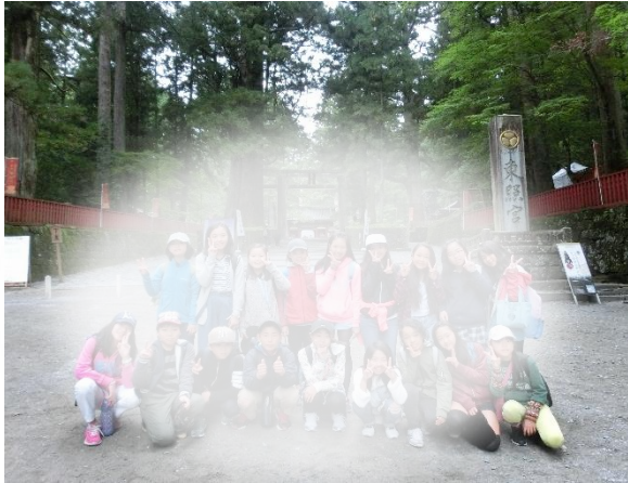
改修で美しくなった東照宮で、記念撮影をしました。