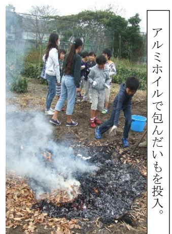
アルミホイルで包んだいもを投入。