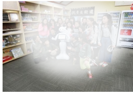
ロボット「ペッパー」と記念写真。ポーズとるペッパー。