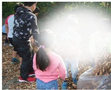
枯れ葉こんなに集まったよ！