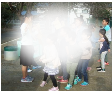
今日のたてわり朝会は、枯れ葉集めです。