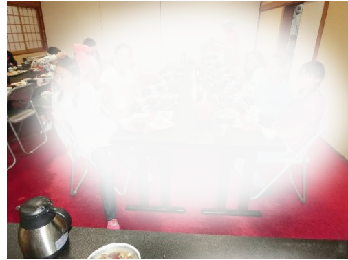
食事の様子。昔の修学旅行とは異なり、リッチです！