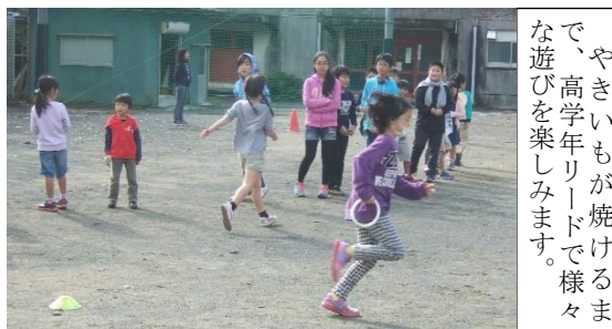
やきいもが焼けるまで、高学年リードで様々な遊びを楽しみます。