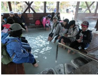
足湯に浸かって、気持ちいい！