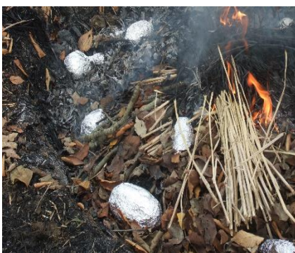
うまく焼けるかな？