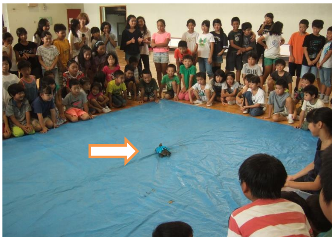
みんなと 最後のお別れです

この日は、児童朝会の後半に全校体育館の後ろに集まり、「かめさん」と最後のお別れ式が行われました。