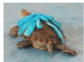
リボンでおめかしした かめさん

環境省は、本年7月に、このアカミミガメを特定外来生物に指定し、2020年を目途に輸入や飼育を禁止する方針を出しました。今後「か