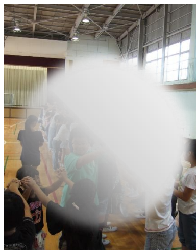
お別れは、アーチを作り！ その中をケースに入った「かめさん」 が通りました！