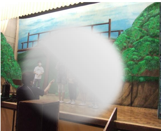
朝一番で練習をした4名、 本番では素敵な朗読劇を 披露してくれました。