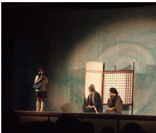
劇団員の方に交じって、少ない練習時間 で女優に転身。大活躍した児童 左