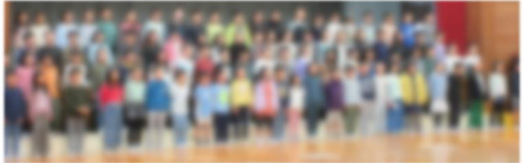
2年生 音楽物語「スイミー」

冬休み前、体育館で音楽集会が開かれました。かわいらしい2年生、一生懸命の4年生、さすがの6年生、心豊かになる時間でした。