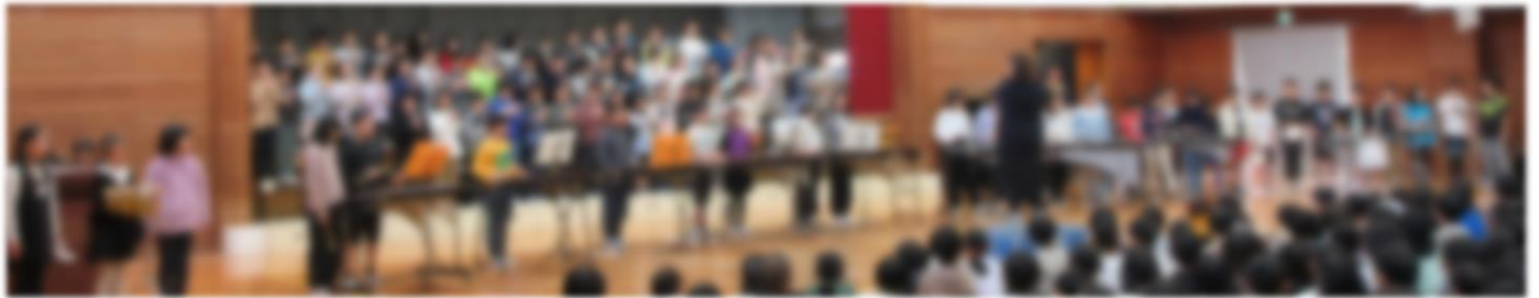
4年生 「もののけ姫」「トゥモロー」2曲も！！息の合った演奏でした