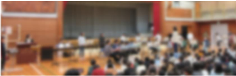
6年1組「ミッションインポッシブル」 2組「レイダースマーチ」 3組「アンダー・ザ・シー」