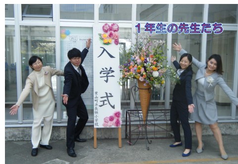
「先生たちも、みんなと頑張るよ！」

心細くて少し涙目になっていた1年生も、6年生の手をしっかりと握って教室に向かっていました。