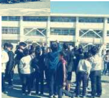
「5年〇組～」と声をかける →