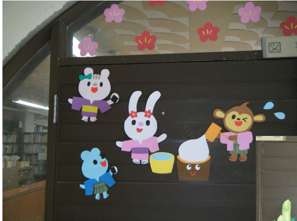
図書室入口 お正月飾り