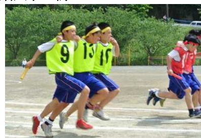
練習の見事な成果を発揮