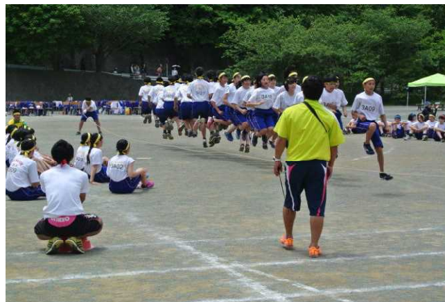
大会新記録の樹立