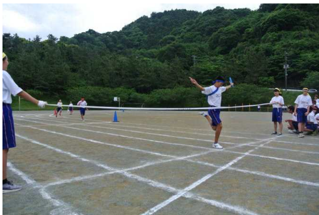
劇的・見事なレース