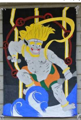
旗デザイン賞 (青)・ブロック表現賞 (黄)