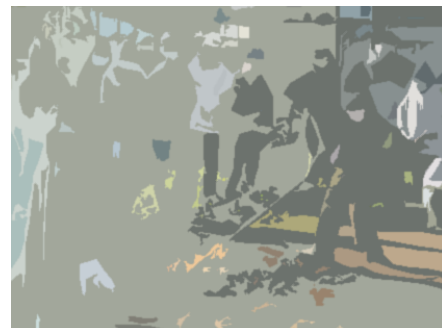
(やきいもの火つけ)

テクノロジーを利用するスキルを学習を進めると共に、人間的な活動を大切にしていきたいと考えています。