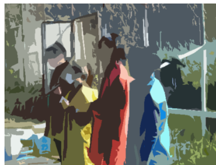
(実行委員による進行)

今年は、PTAの企画と合同で、賛助会員の方々なども招待し、感謝を伝え、一緒に秋のひと時を過ごしていただきました。