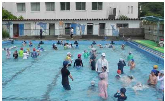
<水しぶきと歓声の上がるプール学習>