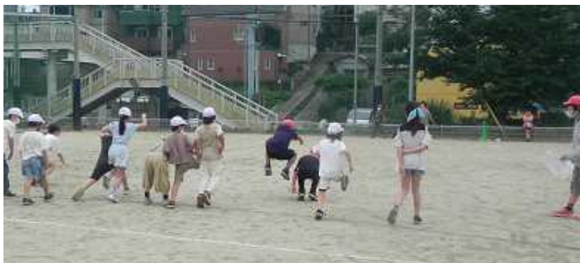
<兄弟学年で楽しく「だるまさんがころんだ！」>