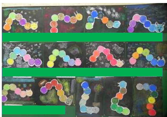
<1年生「まるおしさん」>