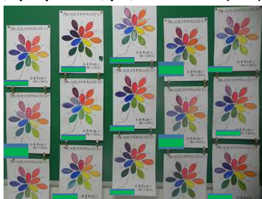
<4年生「きれいな花火を打ち上げよう」>