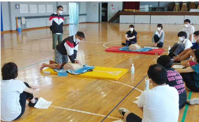
<職員救命救急法講習>

葉山町では今年度、町内すべての小・中学校で水泳学習を実施します。その際、文部科学省から出されている「学校の水泳授業における感染症対策について」に則り、感染症対策を遵守します。また、長柄小、一色小が実施しているスイミングスクールでの授業ノウハウやアドバイス（一定の塩素濃度があるプール水槽内では、全国的にクラスターは起きていない等）も取り入れています。