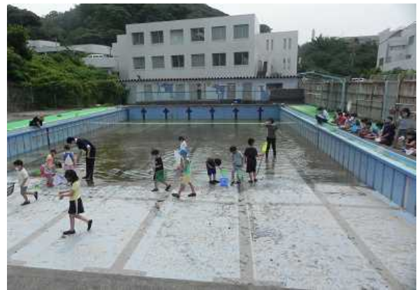
<プール清掃前のヤゴ取り>