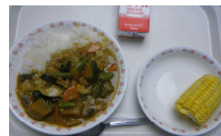
6/27 夏野菜のカレーと1年生がむいたトウモロコシ