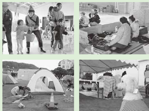
(昨年の一色小学校での訓練)

昨年に引き続き、避難所の運営を中心とした宿泊体験訓練を実施します。当日は、断水・停電を想定し、水道水や電気を使用せず、災害を体感します。ペットの宿泊やしつけ相談もあるため、家族でご参加ください！