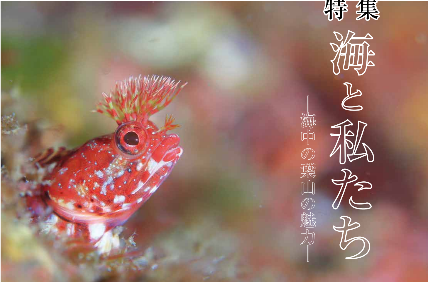
▲ 裕次郎灯台沖・水深10mのアライソコケギンポ