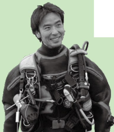
今月号の表紙・4ページの 写真を撮影した

町民の皆さんでも海に潜ったことのある人は少ないかもしれません。こんなに豊かで素晴らしい海が身近にあることを知ってほしいと思います。