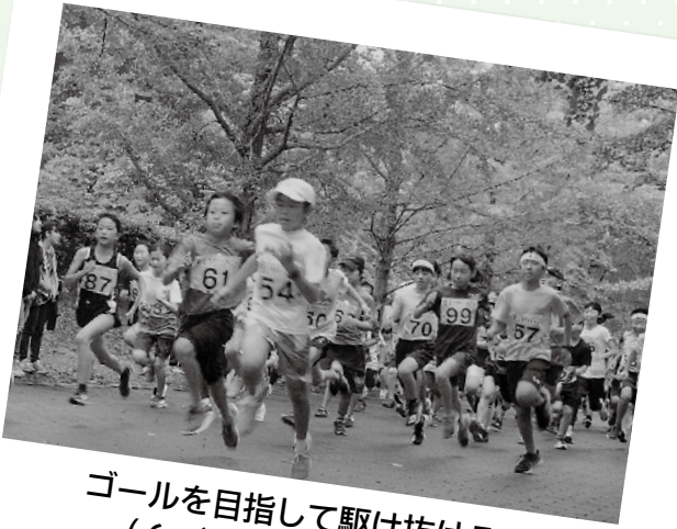
ゴールを目指して駆け抜ける！ (6/9 葉山マラソン)