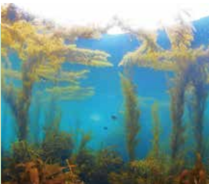
▲ 海藻が森のように茂っています

豊かな葉山の海にも課題があります。今月の表紙写真になっているカジメなどの海藻が、ガンガゼやムラサキウニ、アイゴによって食べられ、岩肌が白くなる現象「磯焼け」が起きていることです。それにより、サザエやアワビの漁獲高が以前に比べて減少しています。