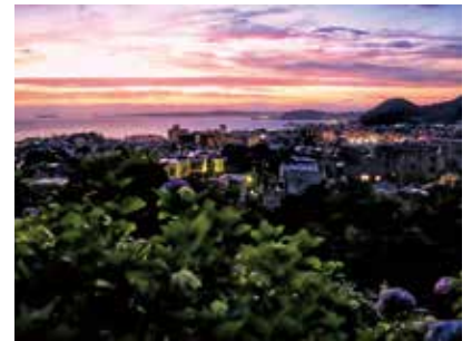
あじさい色の空がきれいだなあ (@hayama_official)

6月中旬から下旬に見頃を迎えるアジサイの花。あじさい公園からは、海の方こうに富士山や江の島が見られます。梅雨の晴れ間の夕雲は、まるでアジサイのように淡い紫色で美しく見えました。