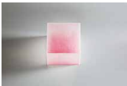
▲三嶽伊紗《イロ》 2010年 アクリル樹脂、蛍光塗料