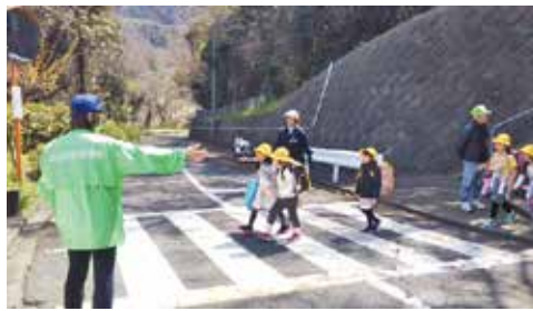
▲子どもは宝、安全も地域の宝

深夜、すやすやと寝息をたてる子どもの顔を見ていたら、寝かしつけに本を読んであげた記憶が片手で数えるほどしかないことに気がついた。親として申し訳ない気