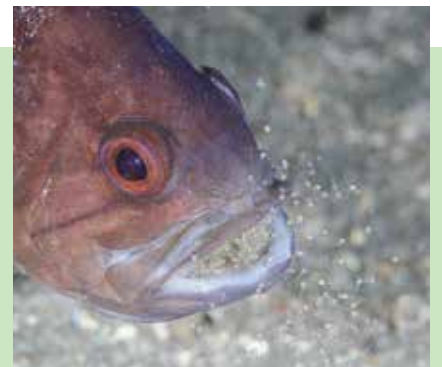
▲ 口の中で卵を育てるクロイシモチ