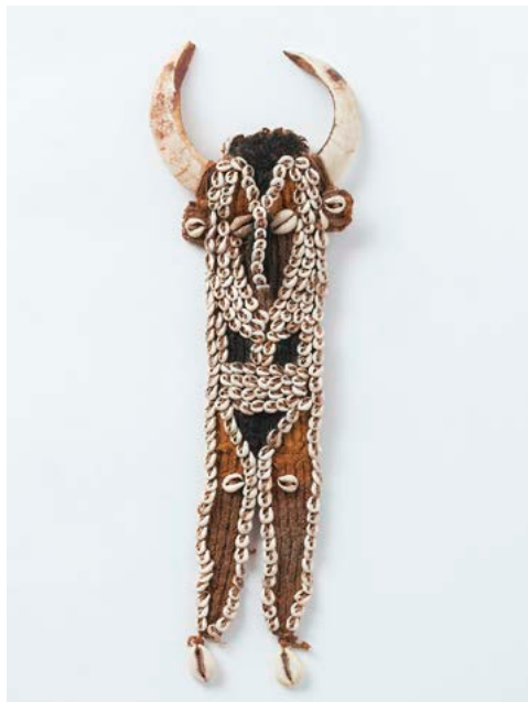
▲胸飾り パプアニューギニア [民族: シシミン (推定)] 国立民族学博物館所蔵