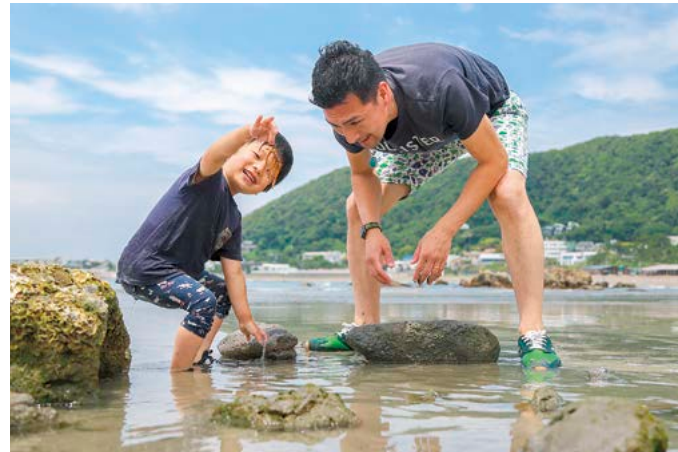
▲ 子どもも大人も楽しめる葉山へ

「子どもから若者、高齢者まで誰もが楽しめる葉山の海水浴場になるには、利用者の皆さんの協力が必要です。思いやりを持って、お互いに配慮した楽しみ方を心がけましょう。」