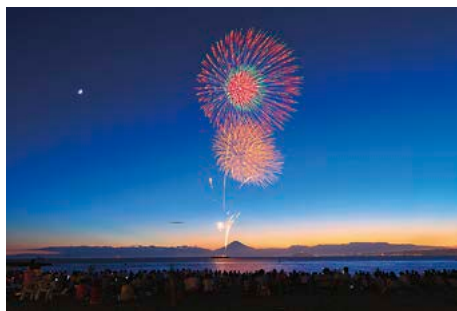
▲ 今年は7月26日開催です(予備日27日)

2015年7月21日、南風が強くなってきたのはお昼を過ぎた頃だった。そして午後2時を回った頃、港から緊迫した連絡が入った。「波と風が強くてできません。」