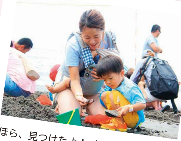
ほら、見つけたよ！（5/19 潮干狩り）