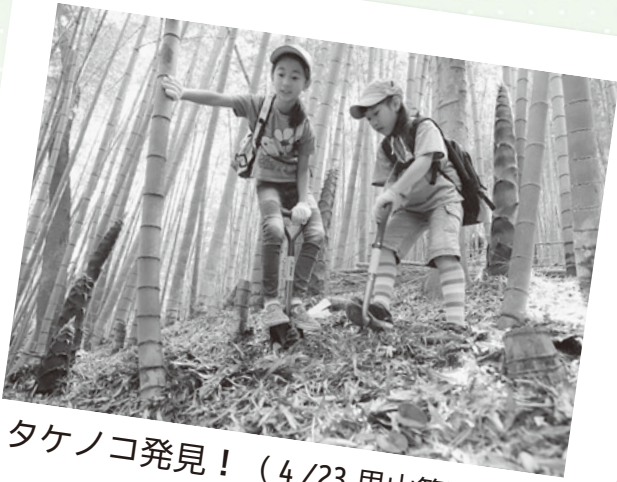
タケノコ発見！（4/23 里山管理体験）