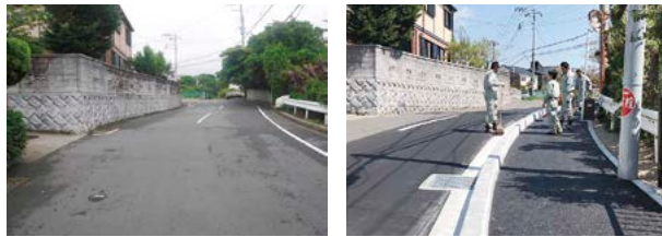
▲下山口「白石橋」付近の都市計画道路 (左が着工前・右が工事後の歩道)

先日、何十年越しの懸案だった道路をようやく拡張できました。長い間、車両のすれ違いや歩行