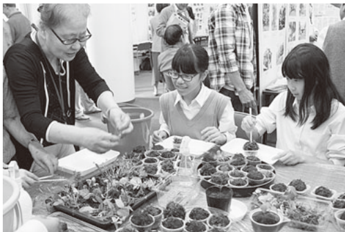
▲昨年開催されたワークショップ

今年で18回目となる葉山まちづくり展では、「知って楽しむ葉山ライフ」をテーマに、葉山ならではの文化や自然環境を守り育てる団体が出展します。展示やイベント、ワークショップに参加して、葉山をもっと楽しみませんか？ 今年は地元食材を使った料理やスイーツのお店なども参加します。