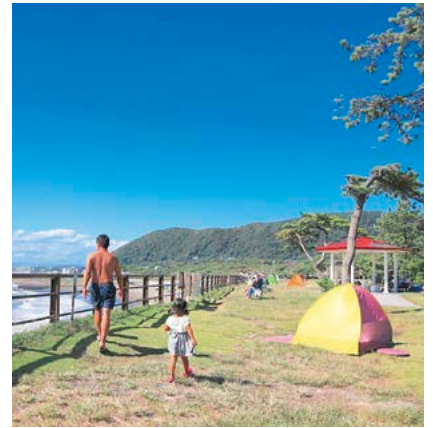
県立葉山公園 (下山口)