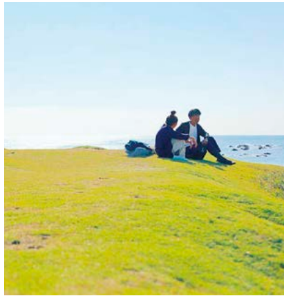
一色海岸・小磯の鼻 (一色)