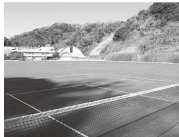
▲整備が完了したグラウンド