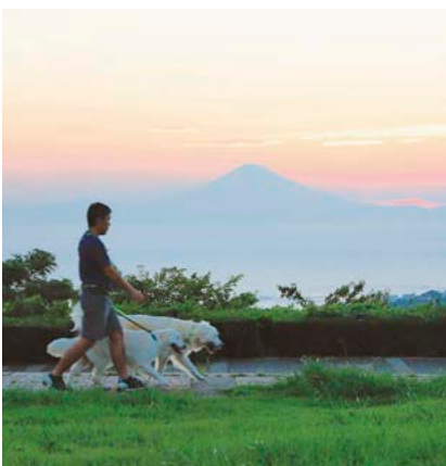
湘南国際村 (上山口)