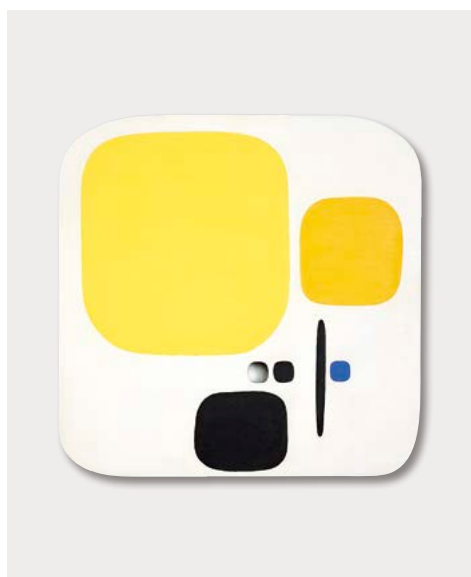
《穴のあるコンポジション》1950年 カーサベルラルテ=パオロ・ミノーリ財団 © Bruno Munari. All rights reserved to Maurizio Corraini srl. Courtesy by Alberto Munari