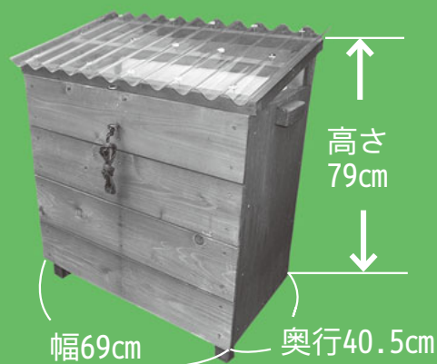
ベランダ de キエーロミニ