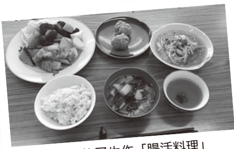
昨年度修了生作「腸活料理」

期間・場所 6月13日(水)から2月8日(金)までの全10回 対象 町在住で「食と健康」に興味のある人(料理が苦手な人も大歓迎です!) ※受講終了後に食生活改善推進員(ヘルスマイト)としてボランティア活動に参加できる人が望ましい。 ※栄養士などの資格がある人はご遠慮ください。