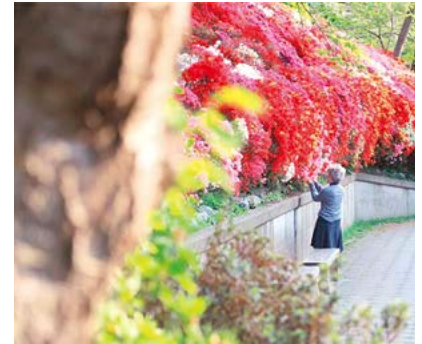
遠目で見てもきれい よく見たらもーっときれい (4/13投稿)

例年よりも早く満開を迎えた花の木公園のツツジ。お花見をする人、近くで写真を撮る人、皆さん様々な方法で季節を感じているようです！