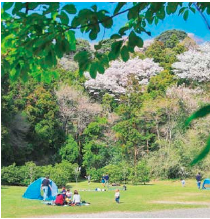
南郷上ノ山公園 (長柄)

葉山には写真映える場所がたくさんあります! ピクニックのあとに、撮影した写真を見て楽しむのも「おしゃピク」の魅力。Instagram町公式アカウント (@hayama_official) の写真とともに、おすすめピクニックスポットを紹介します。