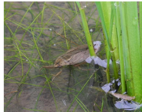
▲復元田んぼの住人 コオイムシ