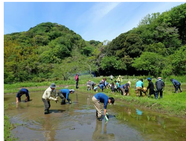
▲田おこし前の草取り風景

葉山で一番足りない「止水域」確保として田圃を復活させ、藪を畑に変え、広がり過ぎた放棄竹林に手を入れ、檜枯れの薪炭林整備に着手して来ました。それも整備の為の整備ではなく、谷戸の集落形成の為の作業が必然的に里山整備になる様に活動しています。