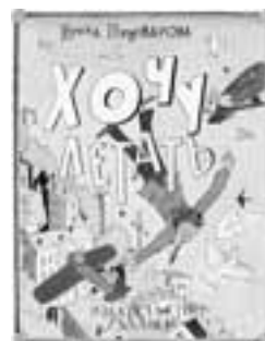
『空を飛ばたい』 (1983年刊)のための原画

問合せ 近代美術館 葉山 一色2208-1 ☎875-2800 FAX875-2968