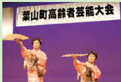
▲若者に負けないパワーが溢れています

今月号の表紙、良いですよね。「葉山の幸齢化率、上昇中」役場の女性職員が考えたキャッチコピーです。年を重ねる幸せ。葉山に健康で幸せな笑顔をどんどん増やしたい、