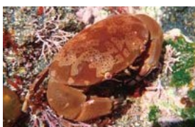
▲シロウミウシ(上)とスベスベマンジュウガニ