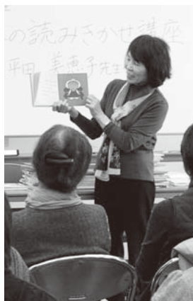
▲例年人気の講座です