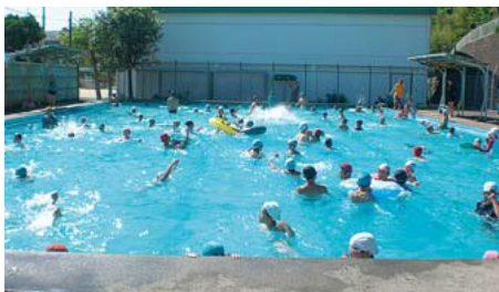
▲昨年の葉山小学校プール開放

プールに行ってみた。この4月から20歳以上の葉山町民なら、全員が町役場でもらえる逗子や横須賀の健康増進施設が使える利用券をもらって。早速行ってみた。 10年前には1kmくらいは普通に泳いだ。それほど体重も変わっていないし、そこそこいけるのではないかと高をくくっていた。けれどもそんなに甘くない。400mも泳ぐと全身が燃えるように熱い。プールの水が体を冷やすためにあるかのようで、ありがたい。そして胸は「苦しい、もっと空気をー」と生死をかけた訴え。で、とりあえず450mでギブアップ。 持久力がだめならばスプリン