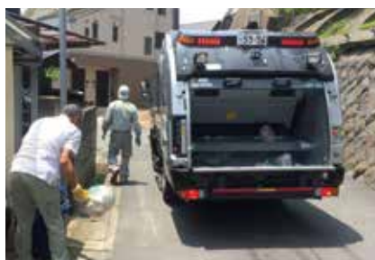
▲収集のようす