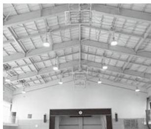
▲ 工事した後の天井