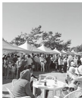
▲色々な出店があります！