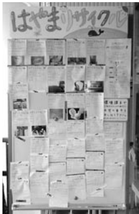
役場入口の掲示板