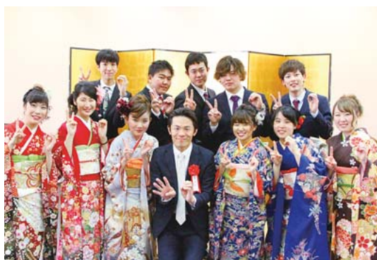
私も今年2度目の成人式の年40歳になります (写真：成人式実行委員の皆さんと)

ハタチの若者は青春真っただ中。自分のことだけで精一杯な年頃のはずが、ふるさとへの愛について聞きたいとは！ 予想外の「葉山愛」という提案に、葉山の若者の誠実さ、豊かな感性にスピーチの前から感動してしまいました。ハタチの若者さえ魅了するこの葉山の地力の強さ、素晴らしさに。 当日は私なりの愛を全力でお伝えさせていただきましたが、式の進行は厳かで素晴らしく、私が彼らに背筋を伸ばしてもらった気さえしました。葉山愛に溢れる289人の立派な新成人の皆さんの輝かしい未来に、栄光あれ。