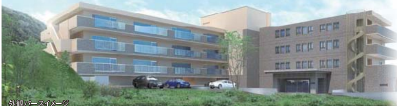
外観パースイメージ

2/4(土)・5(日)・6(月)・11(土・祝)・12(日)・13(月) 18(土)・19(日)・20(月)・25(土)・26(日)・27(月)