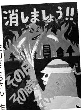
佐山さくらさん 作