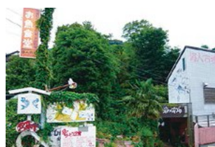
オリジナルエコバッグを作成！ 山の手商店会