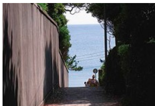
御用邸周辺の静かな通り 一色商店会