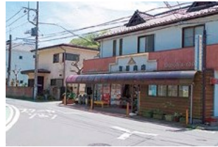
地域に密着したお店が多数 長柄商店会