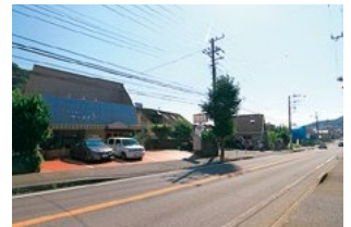
新しいお店が続々登場！ 一色大滝商店会