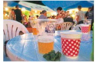
夏のビアガーデンが人気 長柄・葉桜商店会