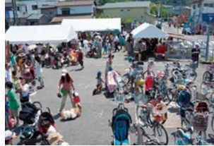
若い世代が盛り上げる！ かざはや商店会