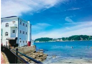
港のそばの景色を見つめ 辻町商店会

あなたの家の近くの商店会でお買物したことはありますか？ 町内には12の商店会があります。色々な商店が集まっている地域で、一つひとつをゆっくりと眺めながら選ぶことで、買うことの楽しみを感じてみてはいかがでしょうか。