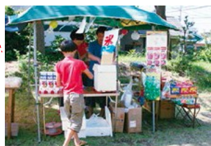
神明社あさいちがにぎやか 下山口商店会