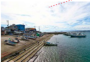
美しい海が地域の宝物 森戸真名瀬 海岸通り商店会