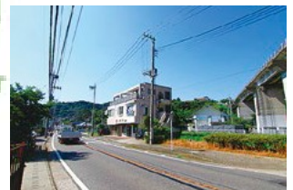
豊かな自然を感じながら 木古庭商店会