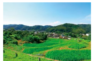
商業・工業・農業なんでも 上山口商店会