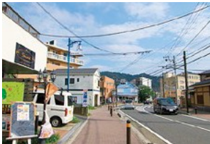
町内最大の商店数 はやま元町商店会