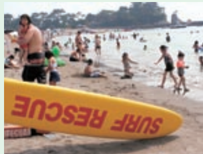
◀波打ち際に置かれた黄色のサーフボード。ここから陸への延長線上に監視所がある。海上で何かあったときはここから出動する。