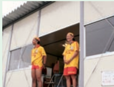
◀監視所。監視員や看護師が常駐する。入口のところには本日の水温、潮の干満、注意報なども掲示されている。