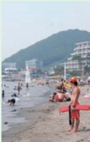
▲歩きながら浜を見守る監視員(右手前)。手に持っているのはレスキューチューブ。トランシーバーを携帯し、他の監視員と連携を取っている。