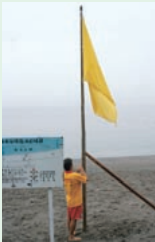
▲監視旗。監視所の近くに立つ。この日は雷注意報が出ていたため黄色の旗。