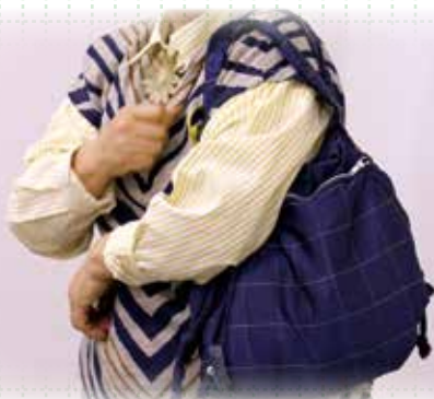
▲ファスナーをつけるなどして アレンジも楽しめます！