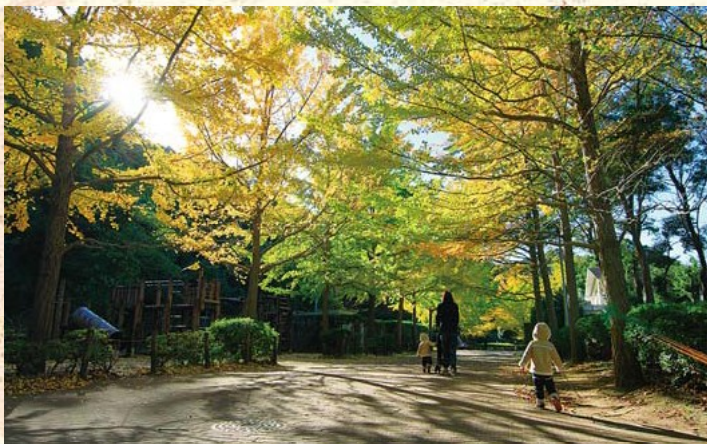
(左上) 葉山ふるさとひろば《今年は10月11日に開催》 (左中) 昨年の葉山町文化祭ダンスコンクールのようす (左下) 昨年の南郷上ノ山公園の紅葉《見ごろは11月中旬》 (右) 葉山しおさい公園でおしゃべりする大高さん親子