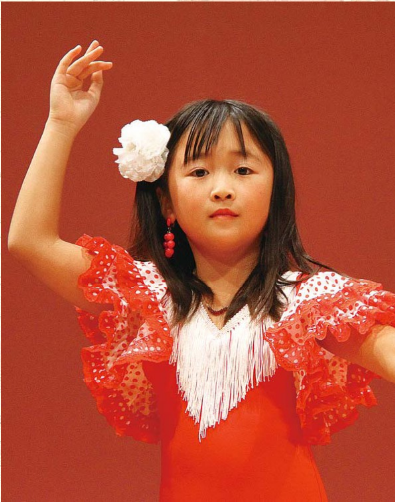
▲昨年の葉山町文化祭でフラメンコを踊りました

夏が過ぎ、涼しくなり始め、過ごしやす季節がやってきました。昔から「文化の秋」と言われているように、秋は文化や芸術に触れる機会が多くなります。町でも「葉山町文化祭」を始めとして、葉山ふるさとひろば、葉山しおさい公園の無料開放などを実施します。