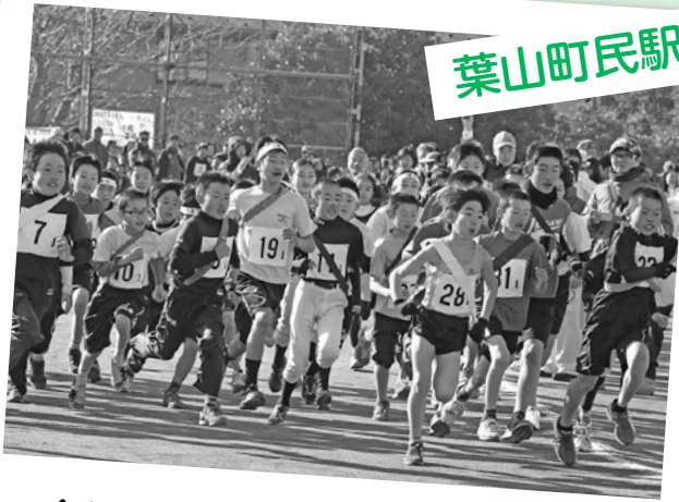
全力で走れ！