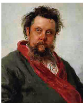
《作曲家モデスト・ムソルグスキーの肖像》1881年