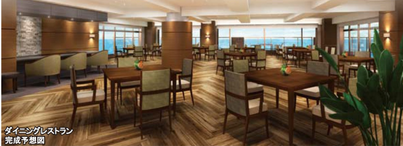
ダイニングレストラン 完成予想図

■土地建物の所有形態/事業主体非所有 ■居室数/41室(うち、二人居室36室・定員77名) ■入居要件/満60歳以上、自立・要支援・要介護 ■居住の権利形態/利用権方式 ■利用料の支払い方式/選択方式