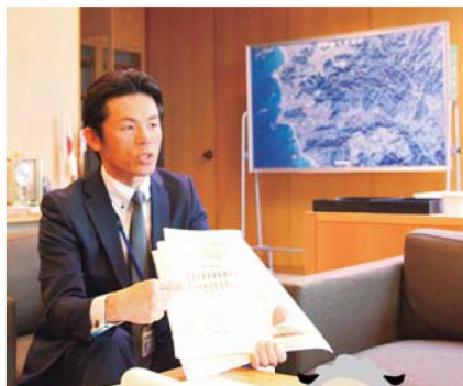
メリーちゃんとハリーくん、都知事のマネです(笑)

※プライマリバランスとは、借金による収入と、過去の借金の返済費用を除いた収支の釣り合いのこと。