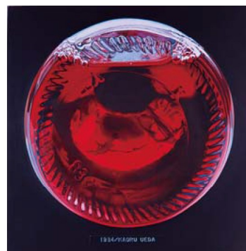
▲上田薫《ビンの底 A》 1984年 油彩、カンヴァス 神奈川県立近代美術館蔵

【3月の休館日】 20日を除く月曜、28日～31日 【問合せ】 県立近代美術館 葉山 ☎875-2800