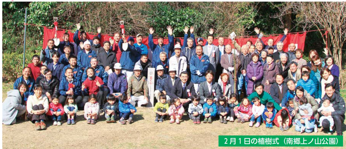
2月1日の植樹式 (南郷上ノ山公園)