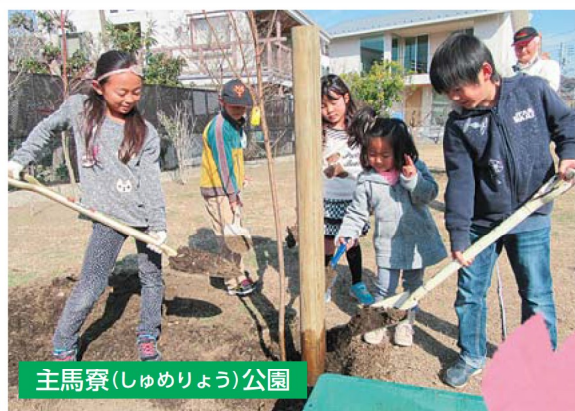
主馬寮(しゅめりょう)公園