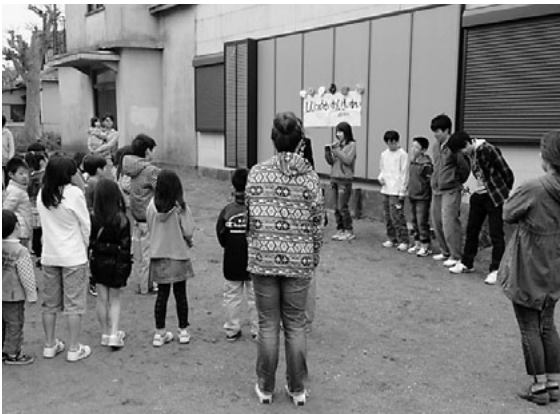
子ども会新入生歓迎会

各子ども会での新入生歓迎会等季節のイベントや子ども会育成連絡協議会行事などで、お兄さんお姉さん役として、子ども達をゲームで楽しませるなど、活動に協力しています。