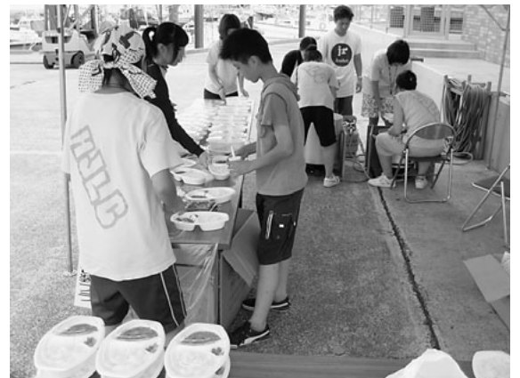
ヨット体験講座（昼食準備）