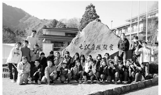
ジュニアリーダー養成講座宿泊研修

また、他市町のジュニアリーダーズクラブとの合同研修や、県で行なう研修へも積極的に参加するなど交流することや情報交換をし、良い刺激を受け、スキルアップも図っています。