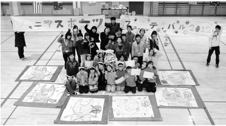
ジュニアスポーツフェスティバル（昨年度）

メンバーは中高生から社会人までの約六十名、うち約五十名は中高生です。月に一回（行事の多い月は二回）教育総合センターに集まり定例会を開催し、協力行事の調整や各種連絡、研修