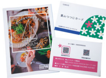
▲詳細は本紙4～7ページ。是非ご利用ください！

「お久しぶりです」マスクをしたままでも、地域の皆さんにお会いすると、その変わらない笑顔に、心の底から安堵します。しっかりとした感染対策をしながらできると、なるべく進めます。