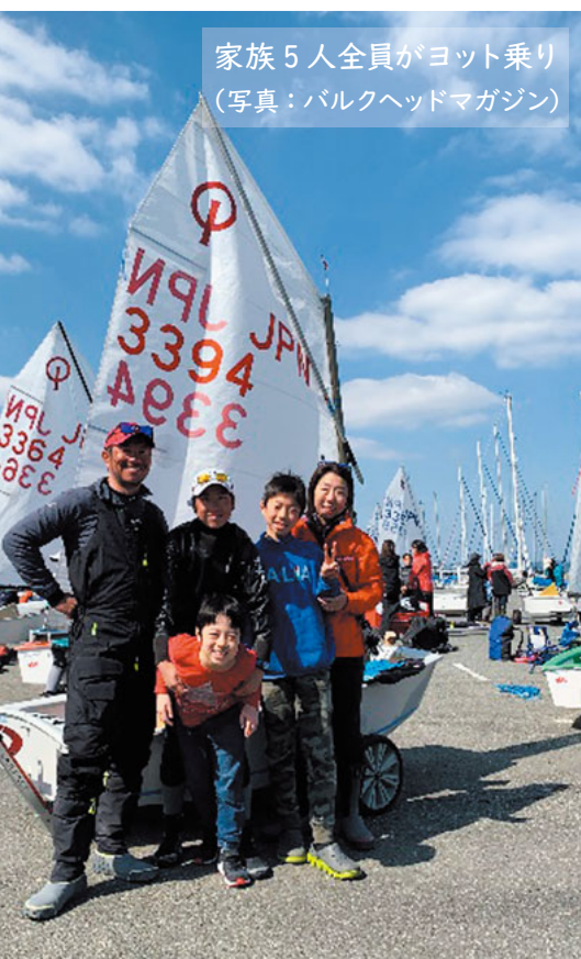
家族5人全員がヨット乗り