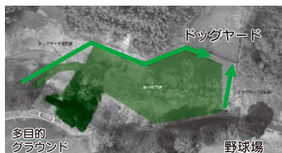
▲概略図(航空写真)※うす緑部分が利用不可(矢印はドッグヤード迂回路)