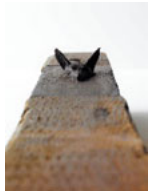
◀若林奮《自分の方に向かう犬Ⅱ》(部分) 1997年 木、油絵具 神奈川県立近代美術館蔵（河合コレクション）