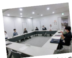
夏から何度も話し合いを重ねました

どんな状況であれ、 感染症対策を第一優先に、しかし思い出に残る式のため、多くの時間をかけ準備してきました。前例がなく難しいことばかりでしたが、今は開催が実現できたという安堵と共に感謝の気持ちでいっぱいです。成人式は新成人が「感謝」をする時間だと思えます。なので誓いの言葉にも多くの感謝の言葉を散りばめて言葉を紡ぎました。成人を迎え、両手に収まらないほどの思いがありますが、少しずつ感謝を恩返しへと形を変えて返していける大人になっていきます。