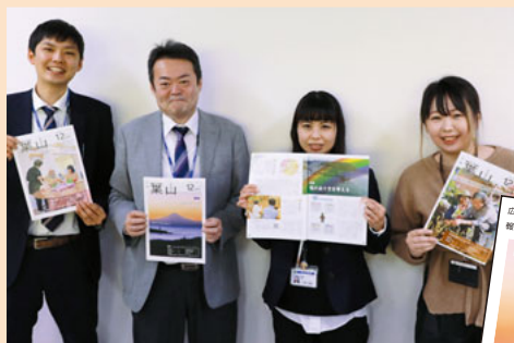
▲ 政策課の広報担当者

今後も皆さんに読みたいと思ってもらえる広報作りをしていきますので、引き続きよろしくお祈りします。