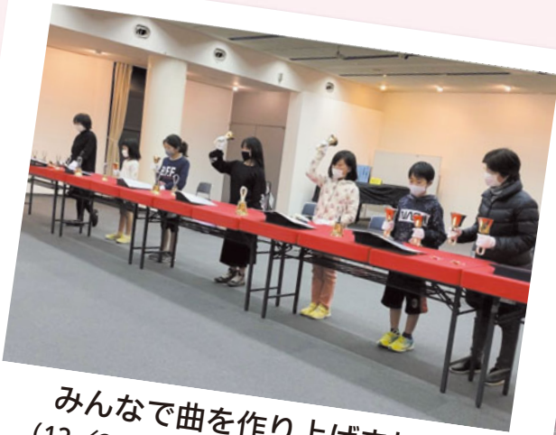
みんなで曲を作り上げました (12/23 ジュニアハンドベル教室)

【1月22日時点の情報です】 新型コロナウイルス感染拡大の影響 で変更される場合があります。