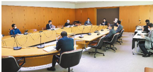
▲ 町のコロナ対策本部会議の様子

「体調が優れないのでもしものときに迷惑かけないためオンライン参加にします」「残念だけど、式典後の二次会は取りやめました」本来なら迷いなどなく、たくさん