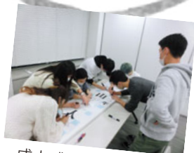
成人式の看板作成中 記念品も考案しました