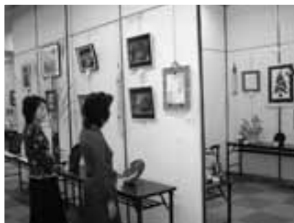
10月4日～6日に福祉文化会館1階大会議室で高齢者や障害者が作成した、作絵画や焼き物、編み物、写真などさまざまな作品を展示しました。