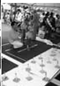
10月15日に役場周辺で手作りのバザール、プラスの饗宴、フリーマーケットなどたくさんイベントが行われました。