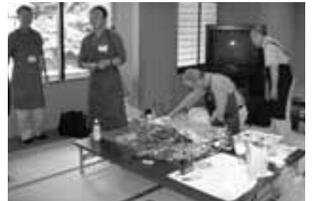
▲前回のおもちゃの修理の様子(おもちゃDr.'sかまくら)