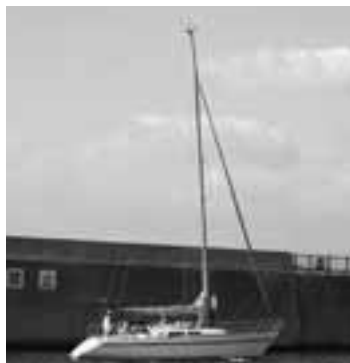
10月14日に葉山新港、森戸海岸沖で障害のある人と家族を対象にヨット競技や関連イベントが開催されました。