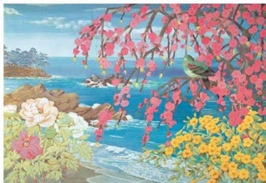
▲堀文子《春》 1969年 紙本彩色 名都美術館

*後期展示が始まりました！《春》など一部の作品は後期のみ展示です。ぜひ繰り返しご来館ください。