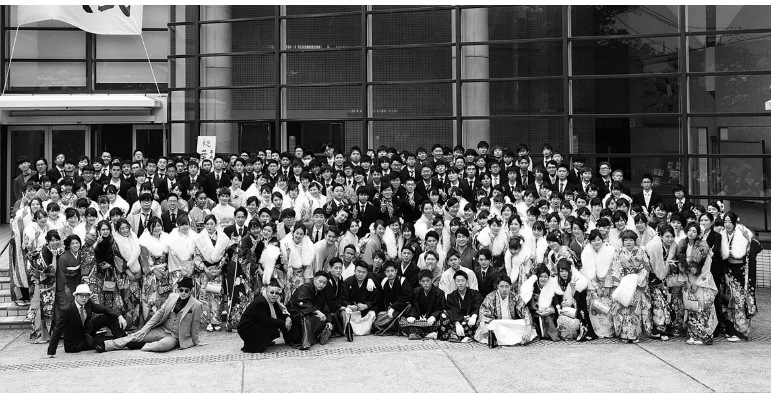
▲ 集合写真等は町HPにも掲載していますので、ご覧ください。

私たち一人一人が社会を担っていることを自覚し、今まで助けられてきた多くの人に対し感謝の気持ちを忘れず、葉山で過ごしてきたことに誇りを持ち、これからの人生懸命に生きていくことを誓います。