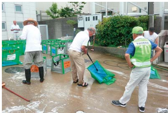
▲資源ステーションのカゴを清掃する町内会の皆さん

平成26年6月から全町で実施されているごみの無料戸別収集と資源ステーション方式。分別を細かくすることや排出方法を変えることは、葉山に住む皆さんに影響があるものです。そのために必要なのは皆さんの「協力と継続」。 導入前に、社会学者の方にこう言われたことを覚えています。 「分別や資源化は一時のこと。住民はすぐにまた分別しなくなり、『資源物の混じった可燃ごみ』が増えますよ。」 しかし、可燃ごみは開始当初から現在までに20%減量を維持し、リサイクル率は42%を超えるまでになりました。以前から住んでいる方ももちろん、葉山に転入した方も多くな