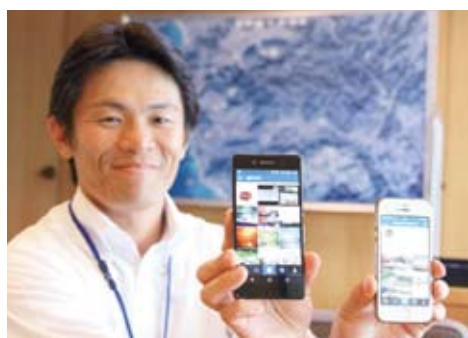
▲町公式は「hayama_aruki」！ 皆さんも「#葉山歩き」の投稿 でご参加ください

先日、役場の若手職員から新規事業の提案を受けました。「役場と関わりの少ない人に向けて新しい広報がしたい。インスタグラムというアプリで葉山好きを集める」というもの。しかし、次が問題。「テーマは役場の限界に挑戦すること」、「叱られてもやる」と。なお、「町長も参加してほしい」というのです。公平性が原則の役場の仕事において、この事業はスマホ保持者限定。アプリまで限定。