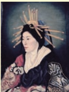
高橋由一〈花魁〉1872年 東京藝術大学 重要文化財

アジアとヨーロッパの出会いを背景に、広い意味での肖像、すなわち人物表現を伴う絵画・彫刻・工芸・写真などに表現された自己と他者の姿の歴史的な展開を、5つの章で紹介します。