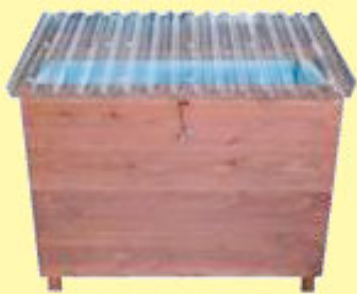
▲1年間で約200台売れたベランダ de キエーロ

燃やすごみの約6割は生ごみだと知っていましたか？環境課窓口では、ライフスタイルに合わせて使える数種類の処理容器を一律1000円で販売中です。暖くなるこの時期は、生ごみ処理を始めやすい季節です。是非ご検討ください。