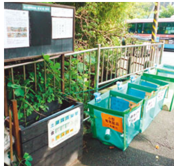
▲牛ヶ谷戸地区にある資源ステーション

戸別収集では、「燃やすごみ」・「容器包装プラスチック」・「プラスチックごみ」の三つを集めます。その他「缶・ビン」、「紙類」、「金属類」などは資源ステーションへ出してください。