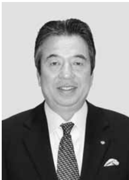
葉山町長 守屋大光