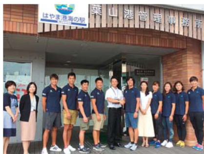
▲ 香港のウインドサーフィンチームとコーチは昔の選手仲間でした！

私には全くないスキルや所作、配慮、これが世界に誇る葉山ブランドの力だと心から敬服しています。 「葉山っていい場所だったよね」 「あのときの葉山のあの人にまた会いに行こう」 世界中のセイラーやゲストの皆さんに上質な町として認められるには、今後もたくさんの方の力や一人一人の笑顔、優しさを伝えていくことが大切だと思います。宿泊施設の不足など、課題もありますが、それはなんとかしましょう。 恥ずかしながら粗野な私には何ができるわけはありませんが、笑顔を絶やさず、思いだけは高く、皆さんのおもてなし力を全力で支えながら走ろうと思っています。