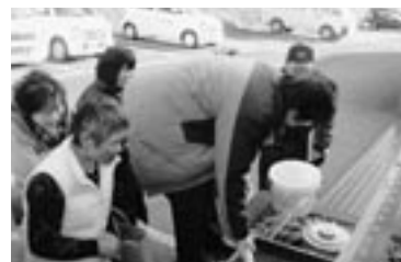
▲キエーロの実演指導

後には、1月に開設した役場の生ごみ処理機展示場での実演も行われ、参加者からは「他の人の状況が聞けてとても参考になった」「ぜひまた参加したい」などの声が聞かれました。